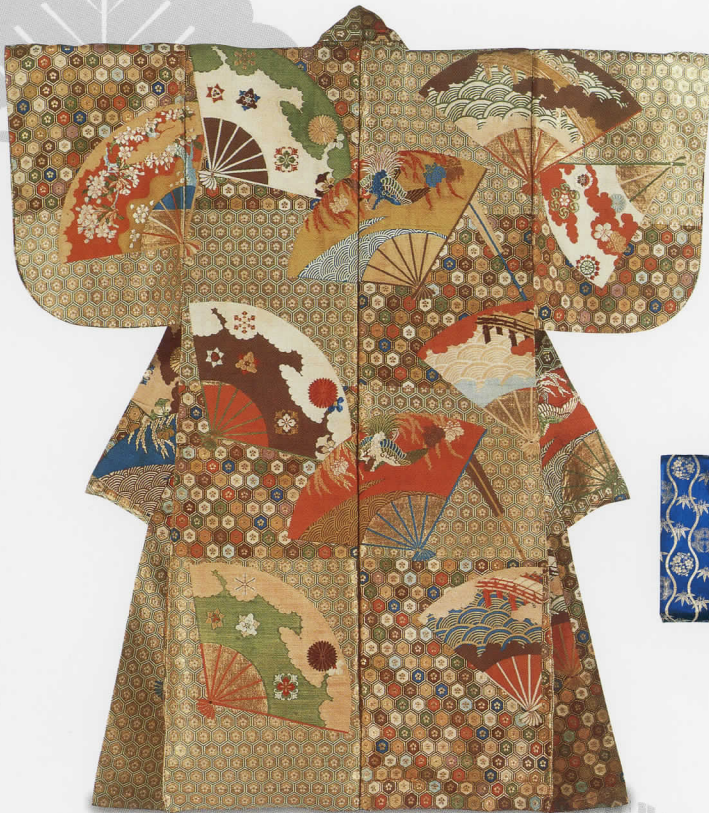
唐織 唐花亀甲に閉扇模様 前田育徳会蔵

※会期中、一部作品の展示替えを行います。前期:10月5日(水)まで、後期:10月6日(木)から