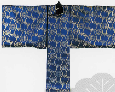
狩符衣 竹立浦に松竹梅丸模様 弘化2年(1845) 高島屋史料館蔵