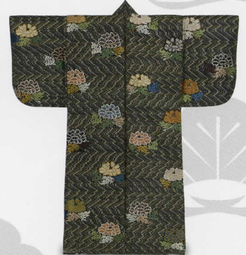
厚板唐織 綾衫に牡丹折枝模様 松坂屋コンクッション J.フロントリテイリング史料館蔵