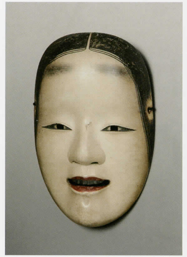
能面 節木増 宝生会蔵

令和4年は石川県立能楽堂開館50周年にあたります。本展覧会で紹介する約80点の作品によって、能に関心を持ち、より理解を深め、能楽堂へ足を運ぶきっかけになることを目指しています。