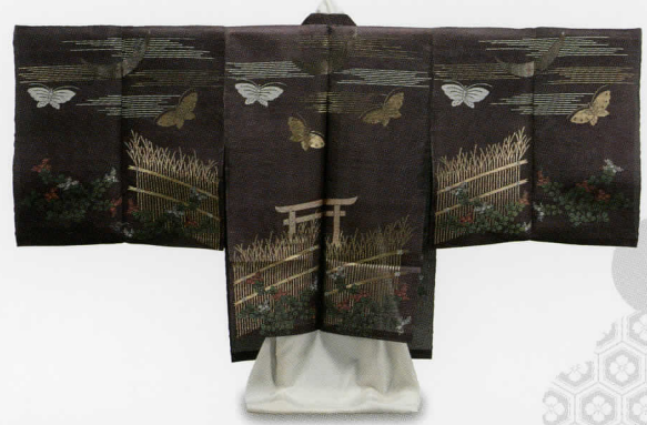
長絹 野々宮模様 文化8年(1811) 野村美術館蔵