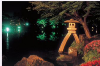
※金沢城公園は毎日ライトアップしています。

春の段:4月28日(木)~5月8日(日)(予定) 初夏の段:6月3日(金)~5日(日)(予定) 日程等詳細は県観光HP「ほっと石川旅ねっと」でご確認ください。 石川の四季観光キャンペーン実行委員会 (県観光企画課内) ☎076-225-1542