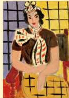
アンリ・マティス《襟巻の女》 1936年 ボーラ美術館蔵