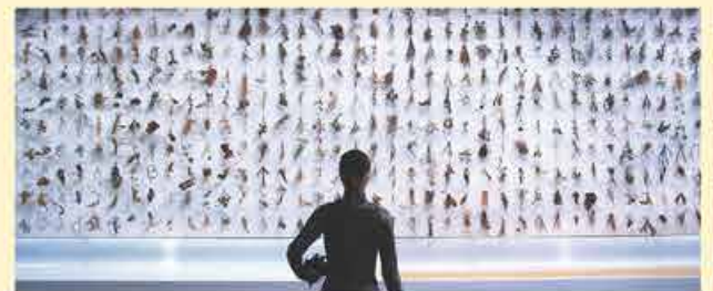
ムン・キョンウォン&チョン・ジュンホ《世界の終わり》2012 金沢21世紀美術館蔵 ©MOON Kyungwon and JEON Joonho

2つの新作映像インスタレーションをはじめとして、アポカリプス前後の異なる時間軸とその接続を精緻に描き出した代表作《世界の終わり》や金石地区(金沢市)での潜在制作の成果など、彼女たちの活動を多面的に紹介します。