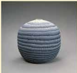
松井康成《楯上曜文大壺》 1979年 茨城県陶芸美術館蔵