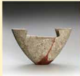
藤崎隆一《備前広口花器》 2012年 東京国立近代美術館蔵

日本工芸会陶芸部会の活動が2022年に50周年を迎えたのを記念して、伝統陶芸の活動の歩みと多彩な展開を紹介する展覧会です。歴代の人間国宝の名品をはじめ、草創期に勢力を二分した日展や伝統の世界に刺激を与え続けている陶芸部会以外の陶芸家の作品、新進作家らの最新作まで、137名の139点で紹介いたします。