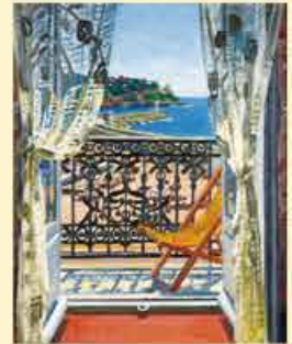
碓伊之助《室より(南仏のバルコン)》 1935年 碓伊之助美術館蔵

師弟の関係性に注目する企画展。石川の美術を担ってきた作家たち、そしてかれらを育てた巨匠たちの共演が見られるこれまでにない機会となります。「師弟」をキーワードに、石川の美術の側面をのぞいてみてください。