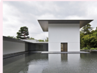
思索空間と水鏡の庭