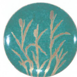
二代徳田八十吉 豊秋飾皿