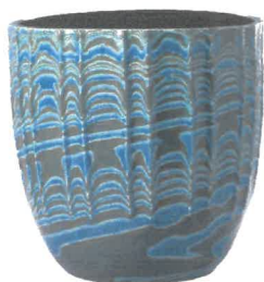
三代徳田八十吉 深厚耀彩線文壺