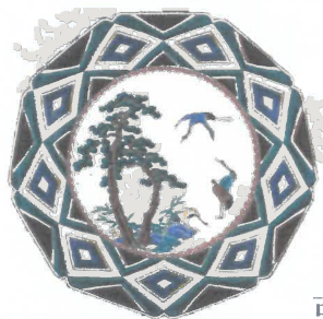
初代徳田八十吉 古九谷欽慕松鶴図九角皿