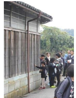
船主の豪邸などの親子見学ツアー