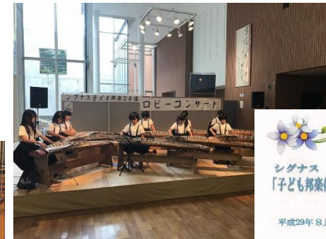
シグナス1階のロビーで練習の成果を見せる発表会を開催 発表会は一般公開し、三曲協会会員も参加し盛り上げた。