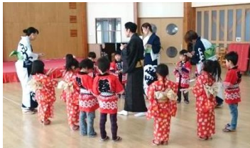
日本舞踊の講師等による保育園児の練習風景

地域の伝統文化である「扇踊り」を継承するため、保育園児や保護者等、若い世代を対象とした伝承教室を新たに実施する。