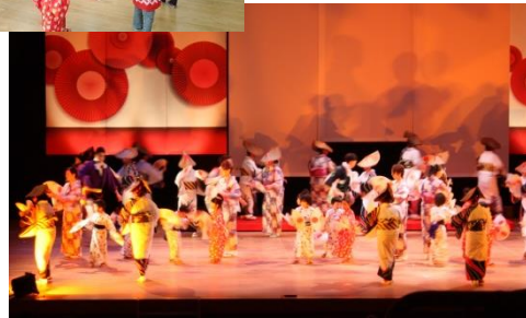
「わがまちの民族芸能まつり」での成果発表