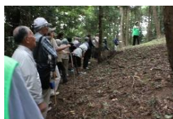
ボランティアガイドによる説明を受けながら古墳を巡るツアー