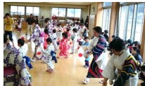
地域住民を 交えた合同 練習