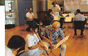
発表会の1ヶ月前から練習開始（計5回）