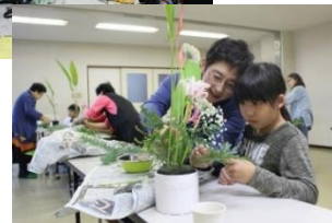
子どもたちが生け花に触れ、親しむことのできる教室を開催