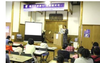
北前船の歴史を学ぶ 講演会