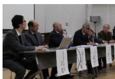
古墳の重要性を伝える講演会