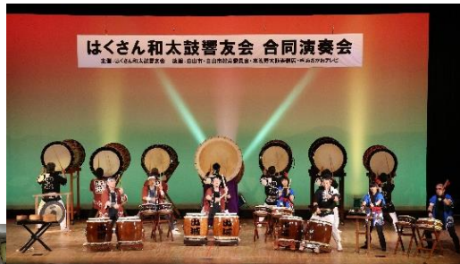
会に属する複数の太鼓チームによる「新松任ばやし」合同演奏