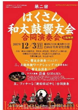
会に所属する複数の団体が合同で練習を実施