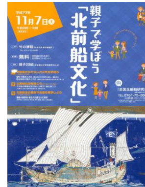
北前船の構造を学びながら親子で絵を描く 絵画教室

地域文化の発展に大きく貢献した北前船に関する講演会、絵画教室、船主集落見学ツアー、からなる親子教室を新たに実施する。